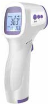
TERMÓMETRO INFRARROJO DIGITAL