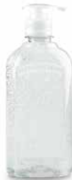
GEL ANTIBACTERIAL 5 Y 10 LITROS