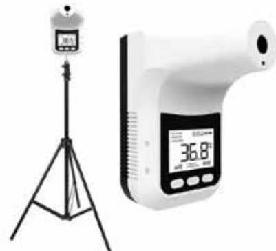
TERMÓMETRO INFRARROJO DE TRIPIE