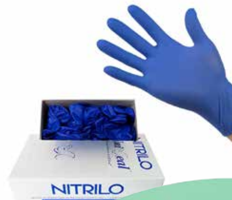
GUANTES DE NITRILO POR CAJA