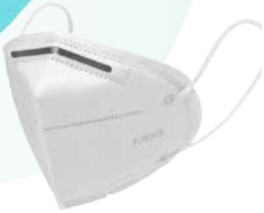
CUBREBOCAS KN 95