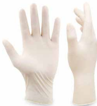
GUANTES DE LÁTEX POR PAR