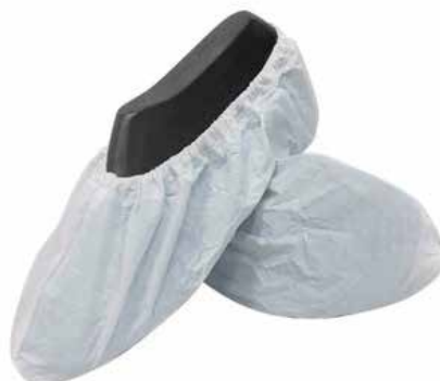
PROTECTOR DE CALZADO