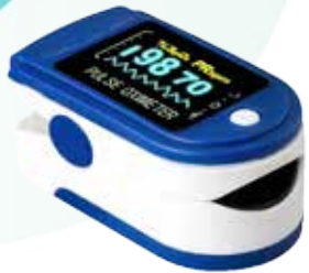
OXÍMETRO DE PULSO PORTÁTIL