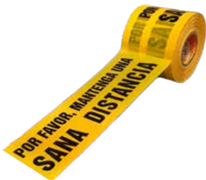
CINTA SANA DISTANCIA