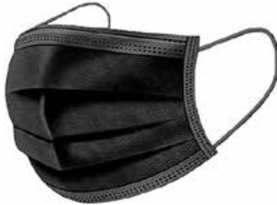
CUBREBOCAS PLIZADO NEGRO